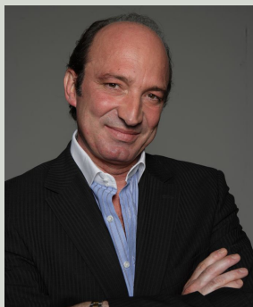
Vakis Kontoes (Atene, Grecia)

Joao Sampaio Goes è chirurgo plastico conosciuto in tutto il mondo per la sua vasta esperienza nel campo della chirurgia plastica ricostruttiva ed estetica della mammella. E' fondatore dell'Istituto Brasiliano dei Tumori di San Paolo dove svolge anche la sua attività clinica privata. E' membro di 25 società internazionali e nazionali e autore di 105 articoli scientifici e capitoli di libri di chirurgia plastica. E' membro della Società Brasiliana di Chirurgia Plastica, della Società Americana di Chirurgia Plastica estetica (ASAPS) ed è stato presidente della Società Internazionale di Chirurgia Plastica ed Estetica (ISAPS). E' stato premiato nel 2010 con il "Raymond Vilain Award ASAPS" e nello stesso anno con il premio ISAPS "Omori Lecture Award".